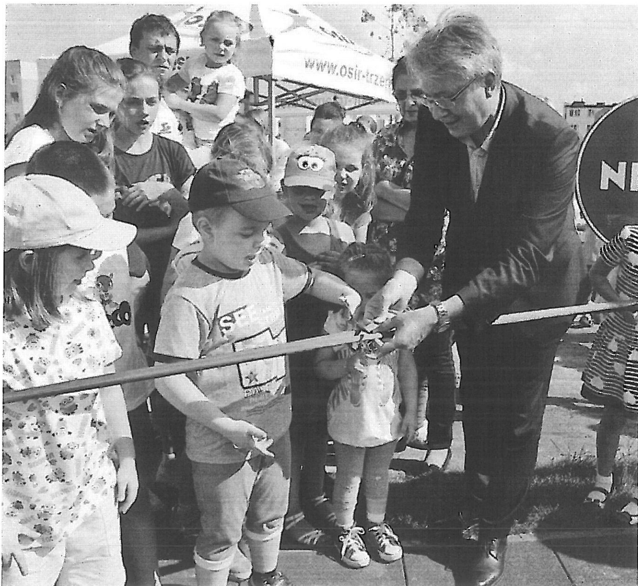
— Srem--_Zdjecia z otwarcia_NIVEA_P_2016 (8).jpg —